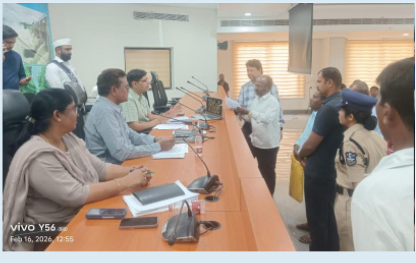
vivo Y56 Feb 16, 2026, 12:55